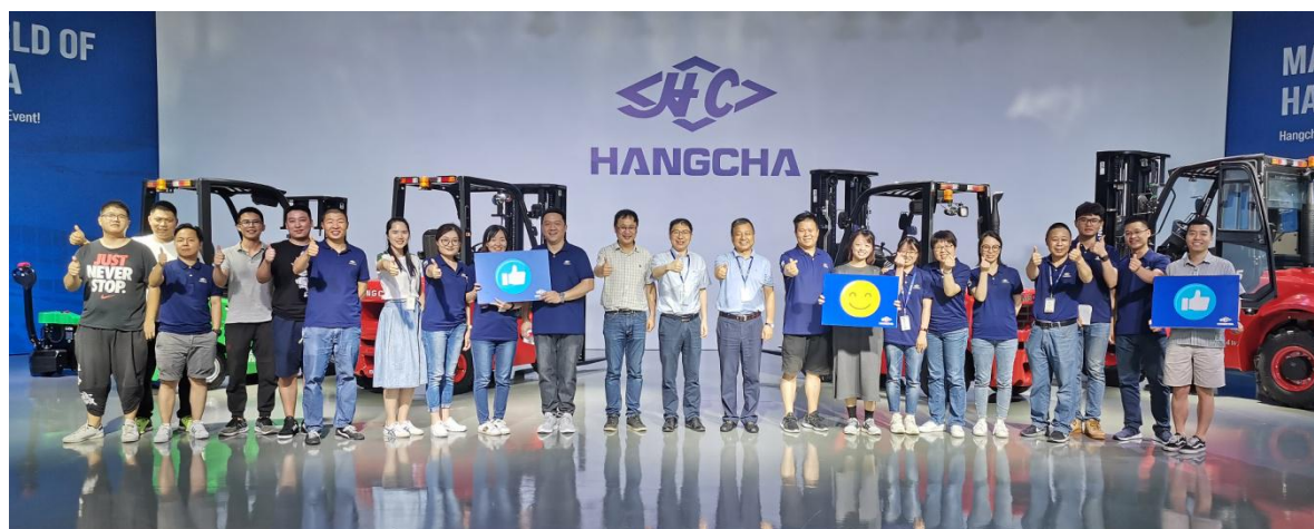
127 届云上广交会——杭叉驾“云”出海

公司每月在抖音、天猫和 facebook 平台进行网上专场直播，参与线上直播互动。国内打开抖音 APP 搜索“杭叉集团”或进入手机天猫、淘宝 app 搜索“杭叉工具旗舰店”；国外通过 Facebook 平台搜索 Hangcha Forklift 进入 Hangcha 主页，即可观看或回看直播。