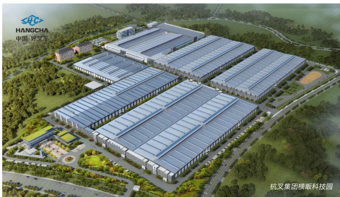
杭叉集团横呗科技园鸟瞰图

信息化管理是企业改进管理提高效率的重要手段，是发展智能制造构建智慧企业的重要途径，公司信息化发展规划以建设“数字杭叉”为工作目标，以实现“数字驱动”为工作核心，梳理各业务流程中数字信息化瓶颈，提升企业业务流程标准化，灵活实现各业务系统数据互联互通，驱动高质量业务系统发展。