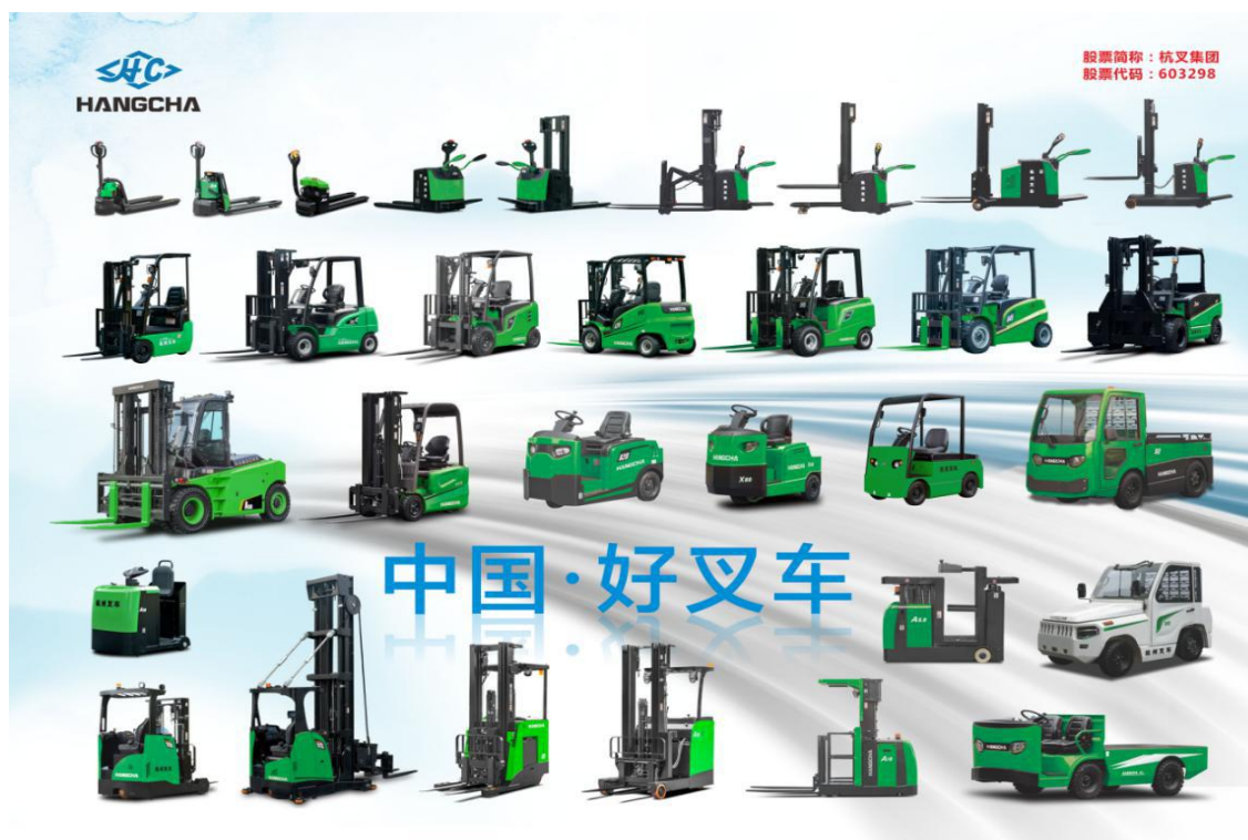
新能源锂电池产品合集

在技术创新方面，持续加大研发投入，统筹开展前瞻性技术和全新研发平台开发工作，公司产品系列完整性、核心技术掌控能力等方面都处于行业领先水平。上半年，公司重点在工业车辆智慧安全、绿色节能、新能源和数字化研发等技术领域开展研究，在清洁排放内燃叉车、锂电池叉车、氢燃料电池叉车、混合动力叉车、高端美款系列叉车、无人驾驶工业车辆（AGV）等产品研发方面取得累累硕果。报告期内，具有国际先进水平的25个系列、130多个车型陆续推向市场，其中AE系列电叉采用了领先的双永磁同步电机系统与创新型后置式配重结构，动力强劲、效率高、能耗低、可靠性好，产品一经推出便引起行业轰动。同时新能源叉车发展进入快速道，公司通过自主创新及相关技术合作，目前是行业中锂电池产品系列最齐全的企业。电动叉车市场推广以锂电池叉车为主，上半年锂电池产品国内外销量达万台以上；氢燃料电池叉车部分车型已开发完成，下半年投放市场，为企业下一步转型升级及新能源叉车的市场开拓奠定了坚实的基础。