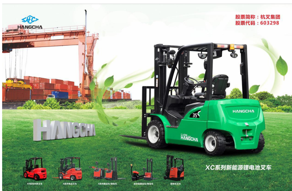
XC 系列新能源锂电池叉车

2020 年初，突如其来的疫情给全球经济和生活带来严峻考验，工业车辆行业一方面受到停工停产的影响，销售订单面临滞后或者取消，另一方面，防疫物资运输保障和人民生活物资供给都离不开工业车辆的身影。在这样的大环境下，上半年全球机动工业车辆总订单量 70.56 万台，与 2019 年同期的 75.83 万台相比，下跌 6.96%。上半年国内工业车辆行业实现总销量（含出口）33.72 万台，同比增长 9.98%。