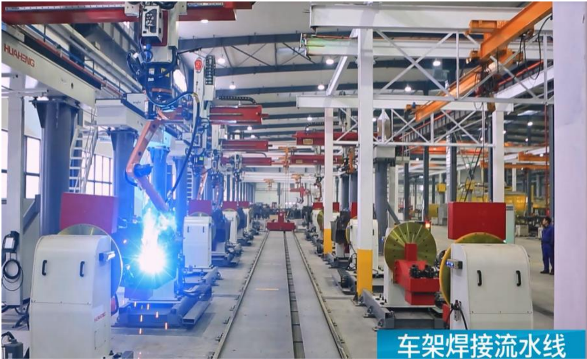
车架焊接自动化流水线

近年来，公司持续加大技改投入，深入实施智能制造，基于 5G 应用技术、工业互联网、智能焊接、自动涂装等智能制造工艺技术，建成行业领先的基于 5G 网络、工业互联网、大数据于一体的叉车智能工厂，实现自动化组装、焊接、涂装、物流。报告期内公司拥有各类智能机器人近 500 台、智能化集成生产线 20 余条、喷涂流水线 10 余条、配送物流 AGV 智能物流车 20 余台、智能化立体库 5 套，形成了年产 25 万台工业车辆和其他物流设备的生产能力。引入精益生产模式，推行 MES 生产流程控制系统，融合焊接、涂装、搬运等各类机器人、自动物料输送系统、智能拧紧机系统、数控加工设备等，大幅提高了自动化和智能化水平，提升了生产效率和产品可靠性，实现由“传统制造”向“现代制造”、“中国制造”向“中国智造”的华丽转变。